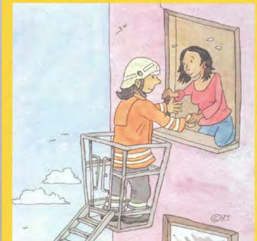
Am Fenster bemerkbar machen