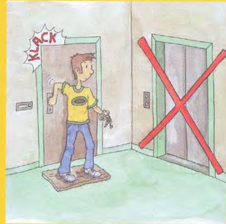
Aufzug nicht benutzen