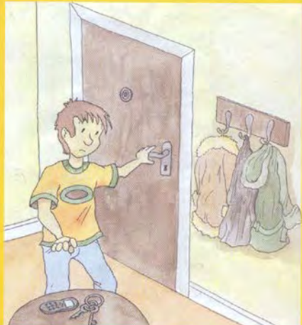
Schlüssel und Mobiltelefon mitnehmen